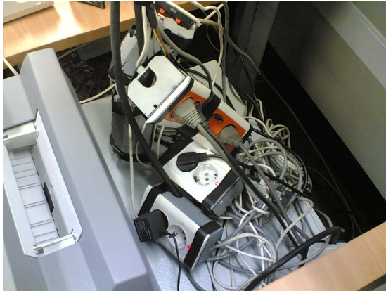
¿ QUIÉN SE ATREVE A METER LA MANO?