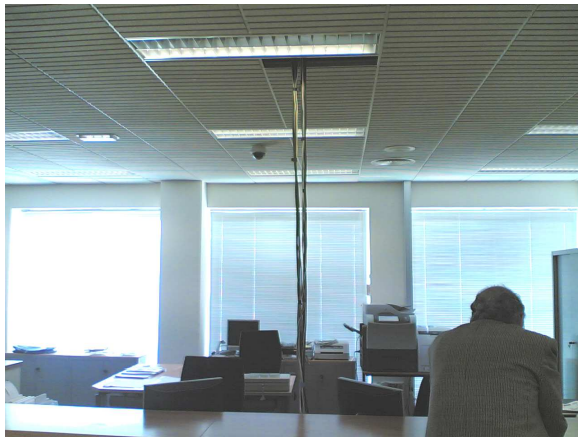
HORCA O CHAPUZA