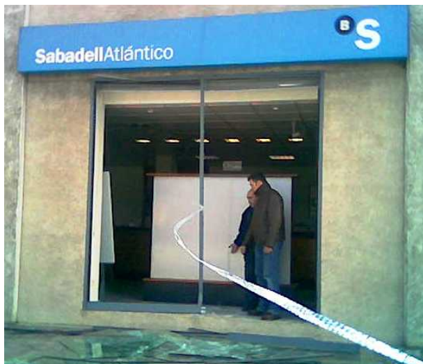
Estado en que quedó la Oficina de Fuenlabrada

Durante la jornada laboral los atracadores empotran un coche contra las cristalerías de la oficina introduciéndose de esa forma en su interior. Uno de los atracadores, mientras, sujeta y apunta su pistola contra un trabajador y dispara después. Afortunadamente la bala no salió del arma. El trabajador precisó asistencia médica en el lugar.